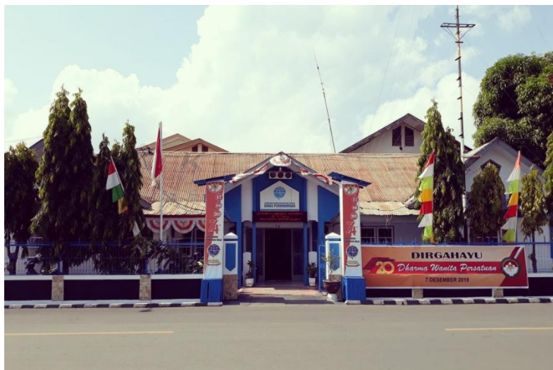
Foto Kantor Dinas Perhubungan Kabupaten Kepulauan Selayar

Dinas Perhubungan Kabupaten Kepulauan Selayar beralamat di Jalan R.E. Martadinata No. 9 Benteng, Kelurahan Benteng, Kecamatan Benteng, Kabupaten Kepulauan Selayar, kode pos 92812, memiliki alamat email dishubkepselayar@gmail.com dan akun social media instagram @dishubselayarkab. Dinas Perhubungan terletak pada titik koordinat -6.1186318 Bujur Timur dan 120.4574719 Lintang Selatan.